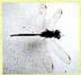
پھیر یاں (ڈرینک ٹائی کی مختلف اقسام)