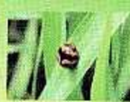
ہلہلی ریزوٹل کی ختم