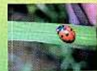
لیڈی برڈ جیٹس