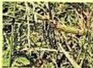
مکوی کی مختلف اقسام

کسان دوست کیڑے یہ ہر گز یہ قاتلہ کیڑے یہ ہر گز عشیتہ (Predators) اور مفٹیکہ (Parasites) فصل کے دشمن کیڑوں کو قدرتی طور پر کھنڈوں کرتے ہیں۔ ناری کیڑے مٹی اور پھندے میں کیڑوں کو پھیر پھاڑ کر کھاتے ہیں مثلاً پھیر یاں (ڈرینک ٹائی کی مختلف اقسام اور ڈیٹیل ٹائی)، آہٹ لاک، لیڈی برڈ جیٹس کی مختلف اقسام، کرلی مٹا، ناری کیڑا، رودھل، نریڈیل، کالی جیٹ، مٹوی کی مختلف اقسام اور مٹی کیڑوں کی مختلف مائٹوں کے (مگدان، مٹی، گویا اور باغ) ایک قسم کے اندرونی جو کو تو تو تو تو تو تو تو تو تو تو تو تو تو تو تو تو مثلاً ریکٹیڈ اور ڈیکٹیڈ گھوڑا، کسان دوست کیڑوں کو مٹیوں میں مخلوط مٹا حل دینے کیلئے ضروری ہے کہ دھان کی کالی کے بعد فصل کی باقیات کو ہٹا دیا جائے اور دھان کے دشمن کیڑوں کا مٹیوں سے باقیات کو ہٹا دیا جائے تاکہ مگدان سے کیڑوں کے ٹھکانے سے کسان اور مٹا حل اور مسدا رنگ مستطوری کو بچا جاسکے تاکہ کسان کو ہلاک نہ ہو۔